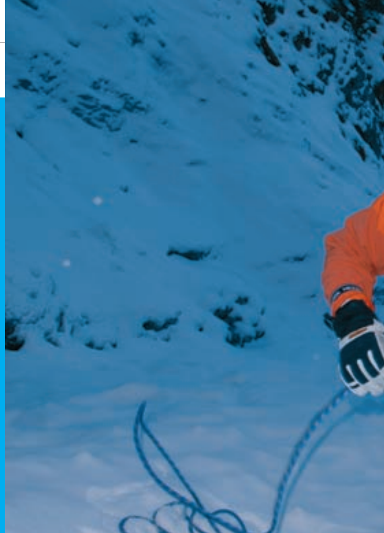
Im Winter sind die Anforderungen an Helme etwas anders als im Sommer. In große Öffnungen

Für die Praxis haben wir die Helme an verschiedene Köpfe angepasst und unter allen möglichen Bedingungen getragen, sogar in der (miefigen, warmen) Kletterhalle. Das Gewicht haben wir auf einer geeichten Präzisionswaage beim TÜV SÜD nachgewogen.