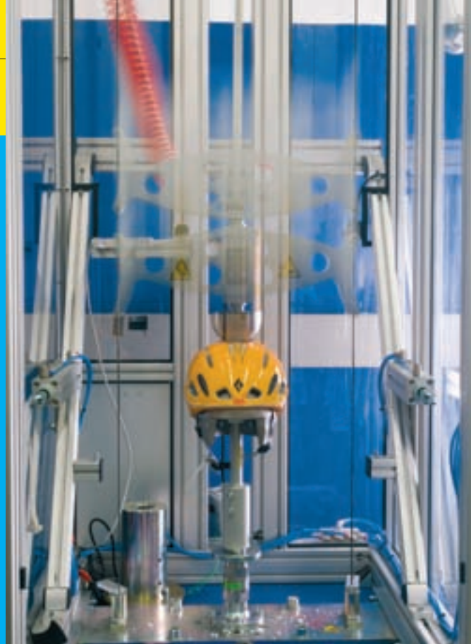
Der Abstreiftest (li.) und die Stoßprüfung (oben) sind Bestandteile des Normtests für Helme.