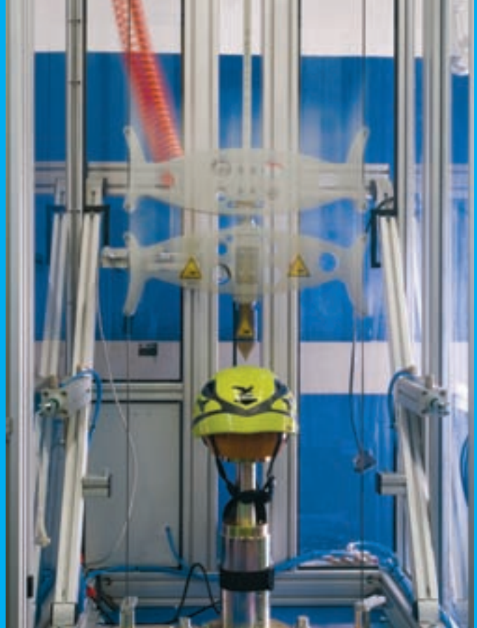
Bei der Durchdringungsprüfung saust ein spitzes Gewicht auf den Helm.

Helme werden immer mehr salonfähig, aber einen Helm aufzusetzen ist immer auch eine Überwindung. Um diese Schwelle möglichst gering zu halten, sollten Helme leicht und komfortabel sein. Wir haben neun Leichtgewichte getestet.