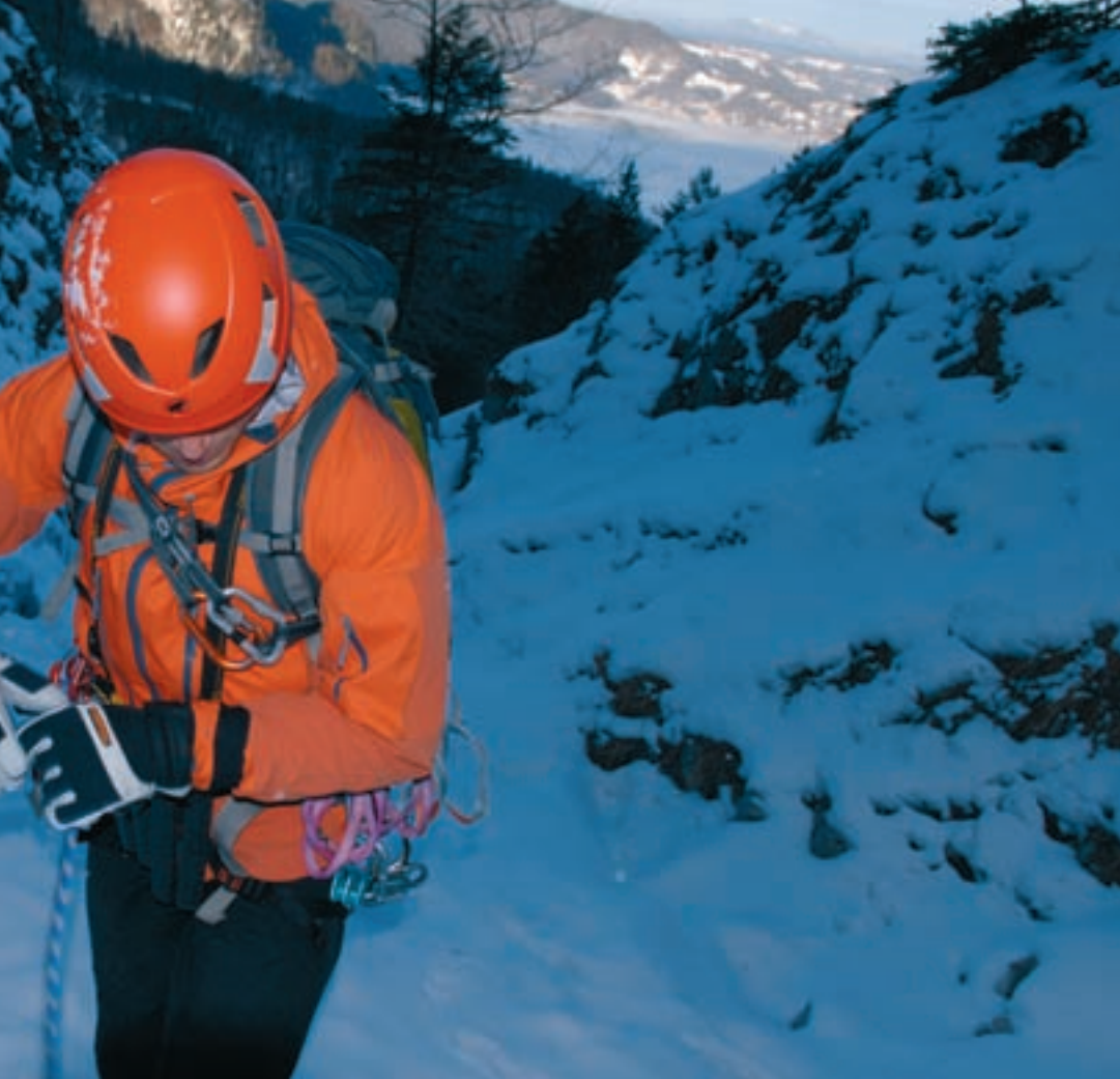
dringt gerne Schnee ein, was sehr unangenehm sein kann.