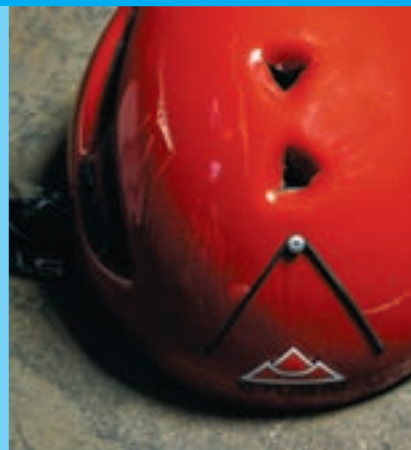
Voll durch: Der Stubai-Helm hat weder den Stoßdämpfungstest noch die Durchdringungsprüfung bestanden.

Ein Helm muss auf den dazugehörigen Kopf passen. Ziehen Sie den Helm auf und stellen Sie ihn über die Kopfweiteinstellung so ein, dass er bei geschlossenem Kinnriemen sitzt, auch wenn Sie den Kopf schnell hin- und herwackeln. Der Kinnriemen ist dann fest genug (und nicht zu fest) geschlossen, wenn Sie noch gut einen Finger zwischen Kinn und Riemen schieben können. Zwickt und zwackt bei dieser Einstellung nichts, steht einer engen Freundschaft zwischen Ihnen und dem Helm nichts mehr im Wege.